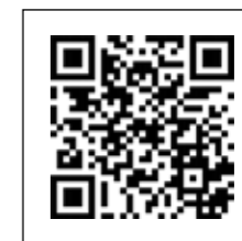
善牧基金會 中區預防暴力宣導