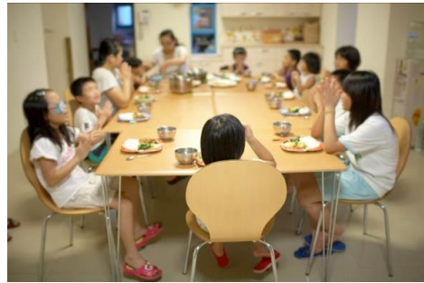
大家一起來吃飯囉！