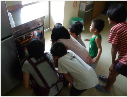
我最愛的「小璇老師點心烘焙坊」