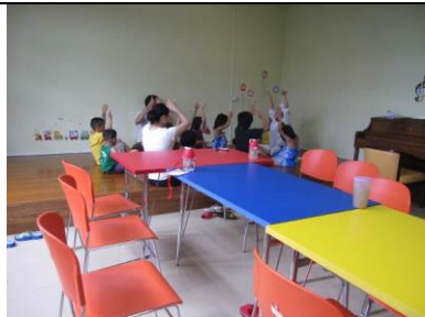
志工哥哥姐姐們帶小朋友做瑜伽