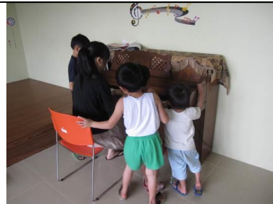
志工姐姐帶著小朋友體驗彈奏的音樂律動