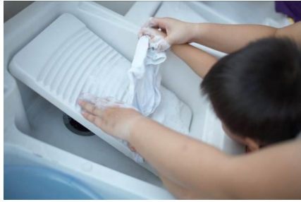
保育媽咪教小朋友洗自己的貼身衣物