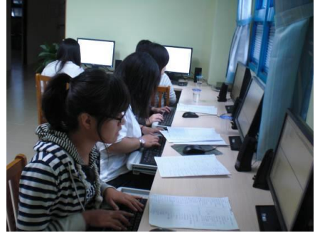
志工們協助愛心贈書資料登錄