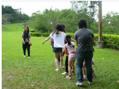
和志工哥哥姐姐們一起在大草皮玩耍