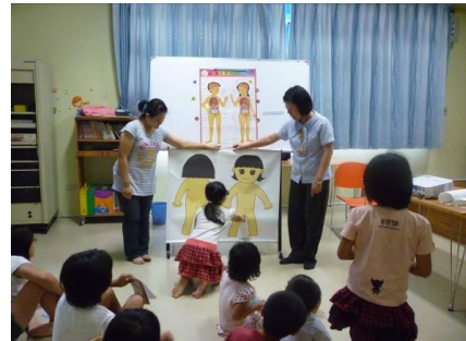
新城鄉衛生所老師講授小朋友「身體紅綠燈」