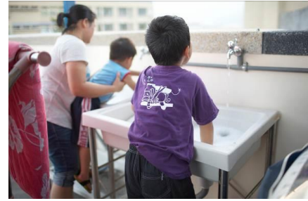
保育員教小朋友洗衣服，搓搓搓