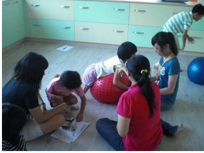
暑假實習生與小朋友一起進行情緒團體活動