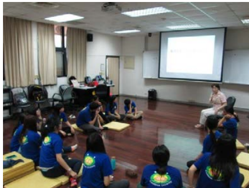
課程透過簡報、分組討論等活動，帶領學生認識暴力。