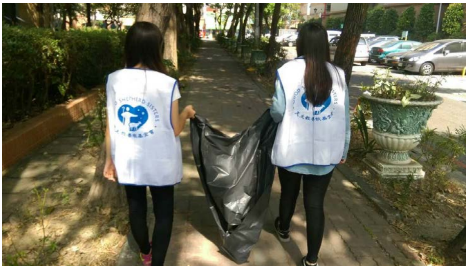
孩子們到社會中做環境清潔的服務，透過分工與合作，完成任務。