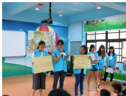
利用講解幫助學生學習保護自己的方法。