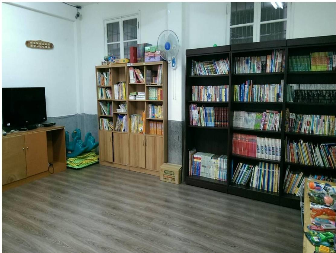
兒童教室-已經鋪上木地點、裝設監視器，提供孩子適當的活動空間。