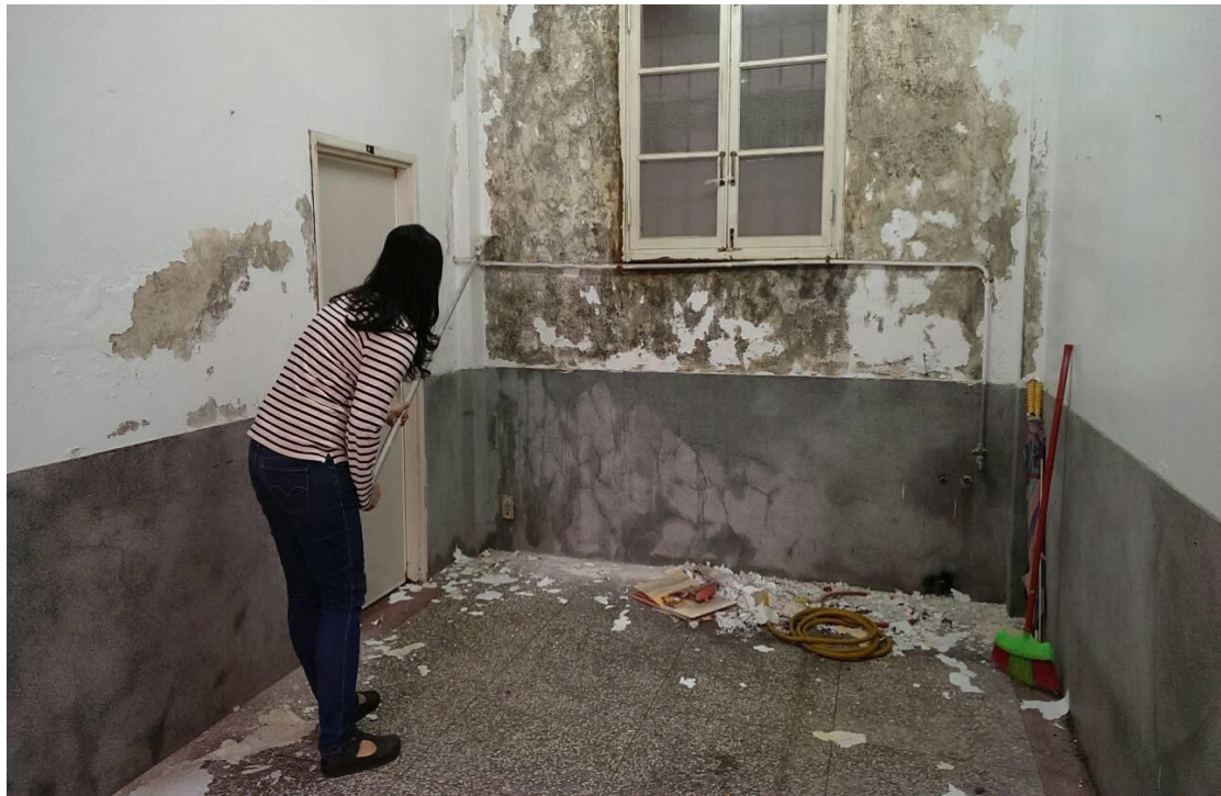
辦公室整修前-壁癌嚴重，窗戶即將掉落。