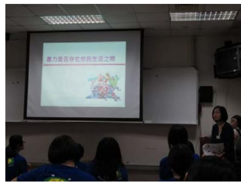
運用生活新聞、統計數據，提升學生對暴力存在生活之中的敏感度。