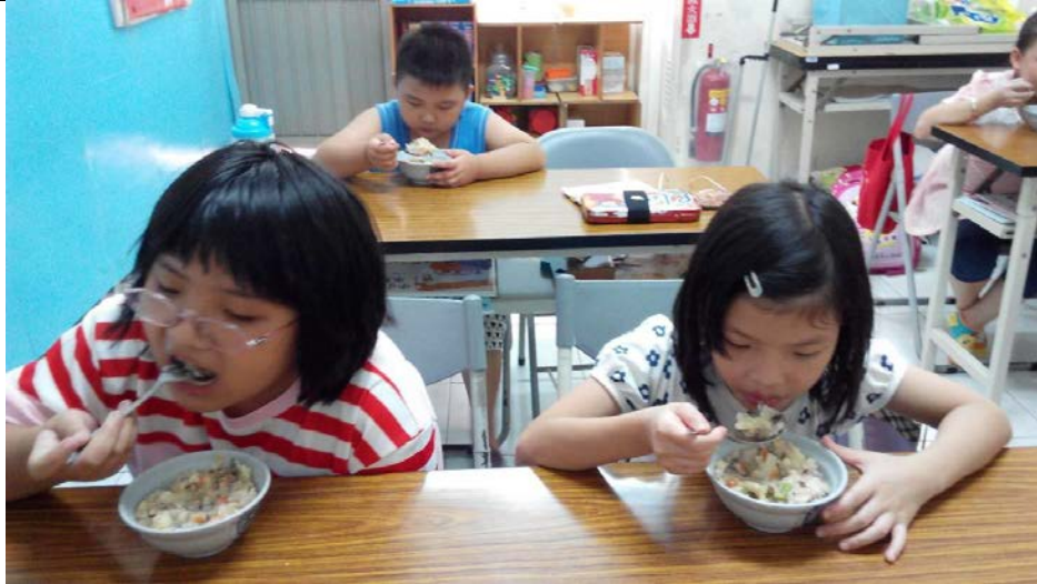
學童點心時間，事後分工做好清潔，繼續完成作業。