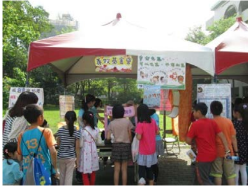
安全生氣闖關活動，小學生可覺察生氣樣貌和學習正確情緒抒發方式