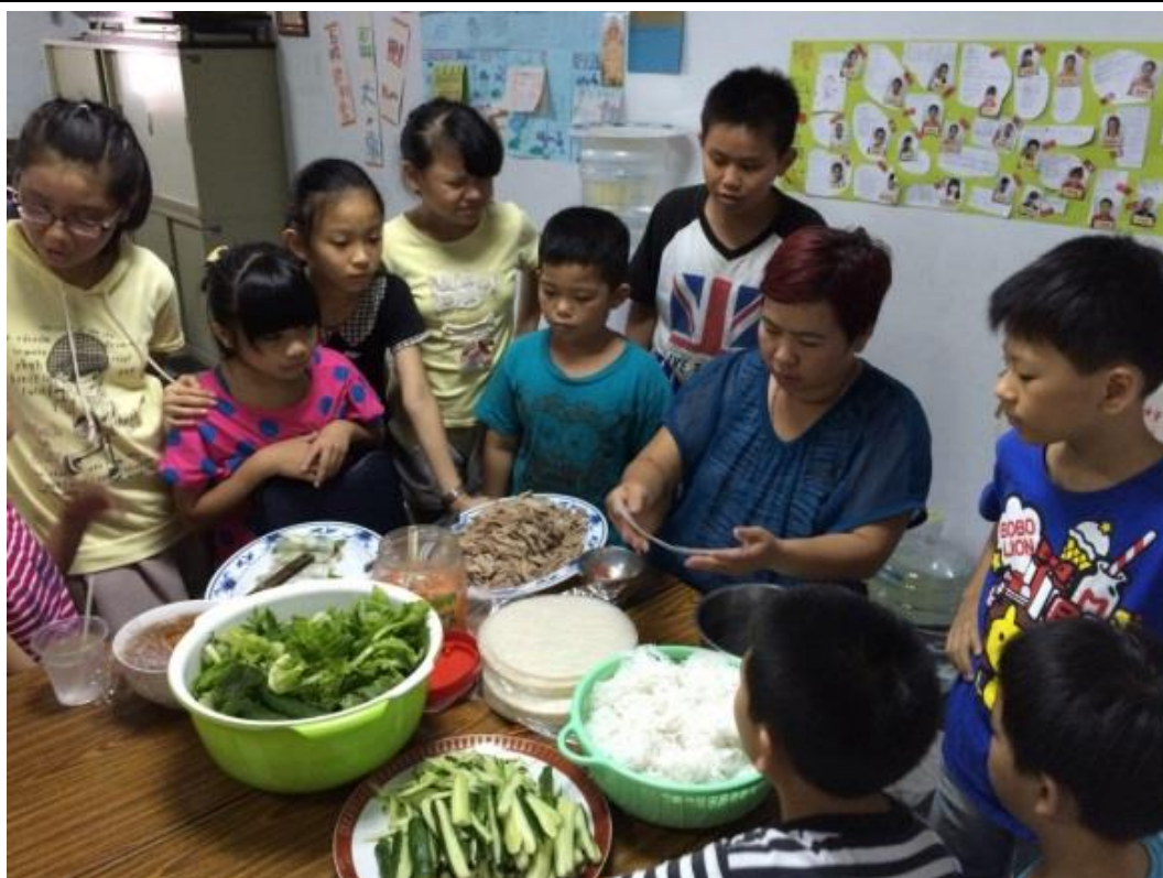
新移民子女平日暨暑期多元課程-從飲食認識母親的母國文化。