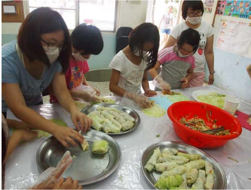
「烹飪課」讓孩子親身體驗做點心的樂趣，並從中讓孩子了解家人的辛苦。