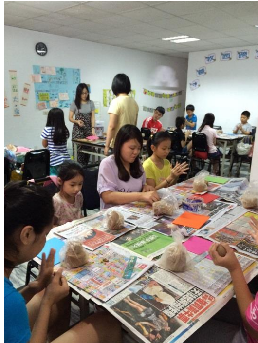
新移民子女平日暨暑期多元課程-才藝課程，以利兒童體驗多元的課程教育。