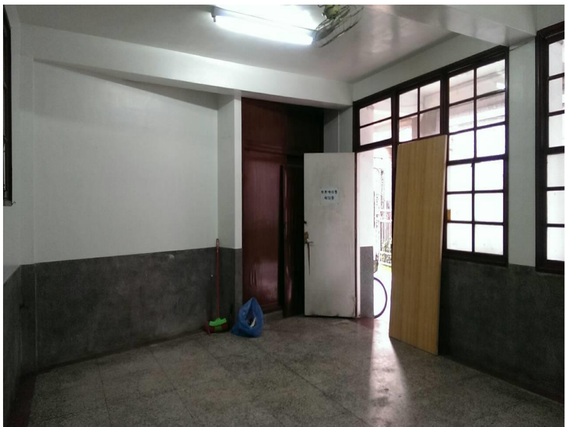
整修前的教室-已清潔好，裝設好照明系統，但門板依舊斑駁快掉了。