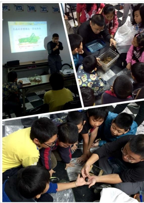
新移民子女平日暨暑期多元課程-認識昆蟲