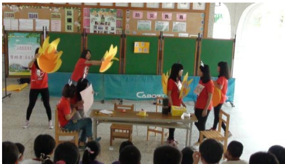
家暴劇透過活潑動態的表演形式，讓小學生理解暴力對人造成的恐懼和傷害。