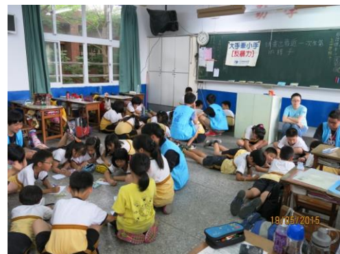
以小組討論和繪畫來引導文化國小學生看見自身生氣情緒。