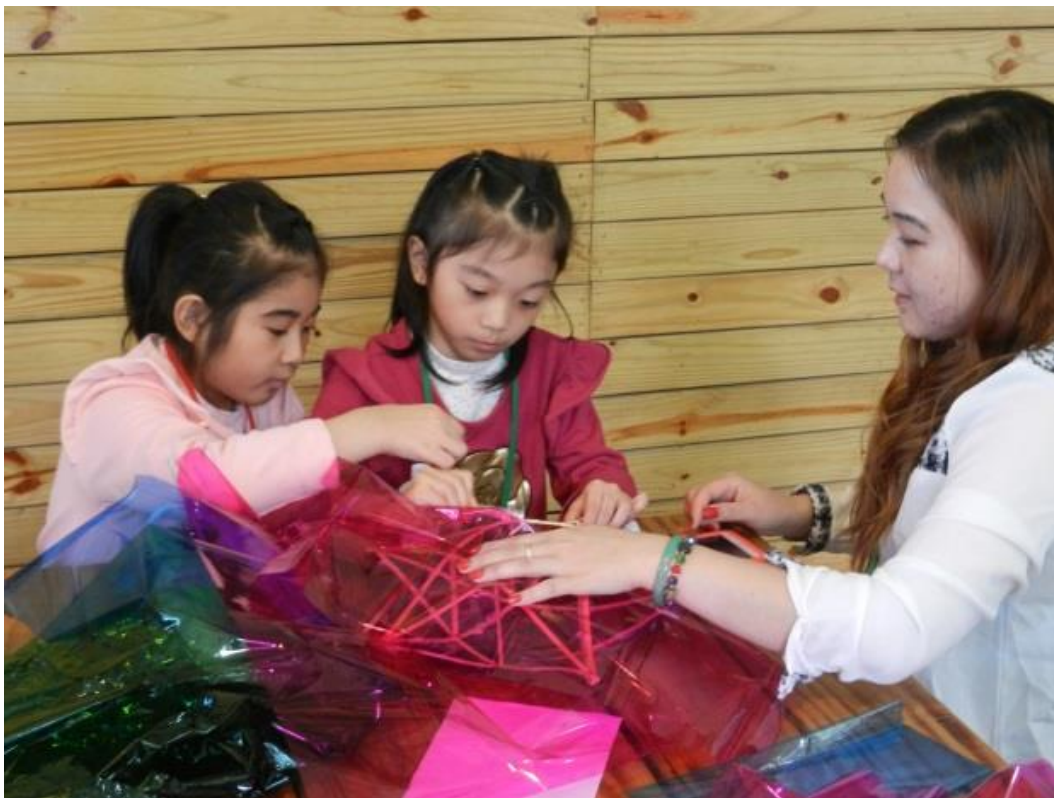
新移民子女平日暨暑期多元課程-孩子與新移民母親一同做越南燈籠，近距離認識母親的文化。