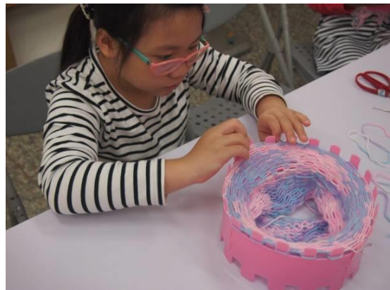
「家事學習」讓孩子體驗日常生活家務的學習，課程安排主要貼近於孩子可獨力完成的事務，例如：縫釦子或織圍巾。