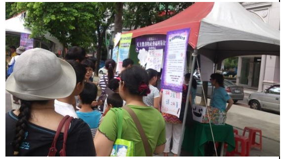
家暴月社區宣導，邀請民眾認識家庭暴力和預防暴力的重要性。