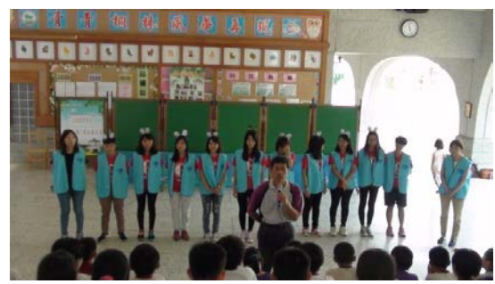
師生們透過欣賞家暴劇的演出，更能理解家庭暴力的相關知識。