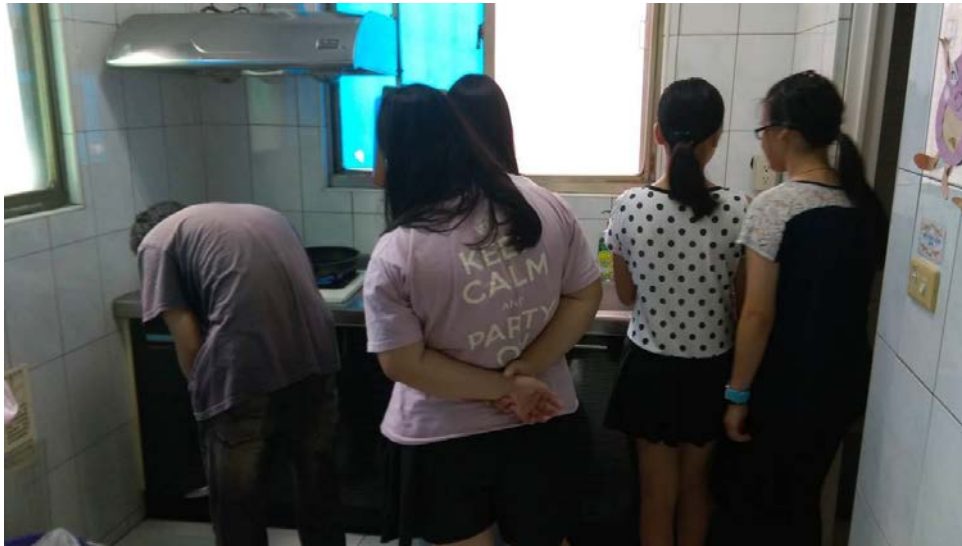
孩子親自製作蛋餅，並送到養老院給長輩品嚐，以行動關懷社區。