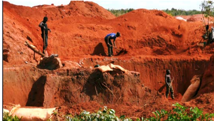
礦工們的所得？ 一天就幾塊美元