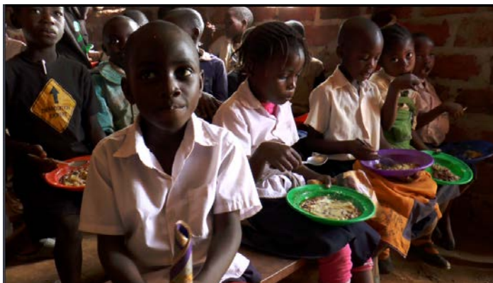
但在學校裡我們每天供餐