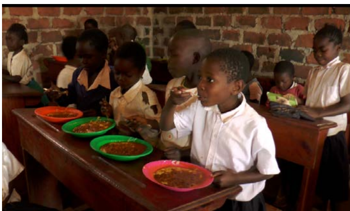
學校供餐計畫—兒童應有吃飯的權利