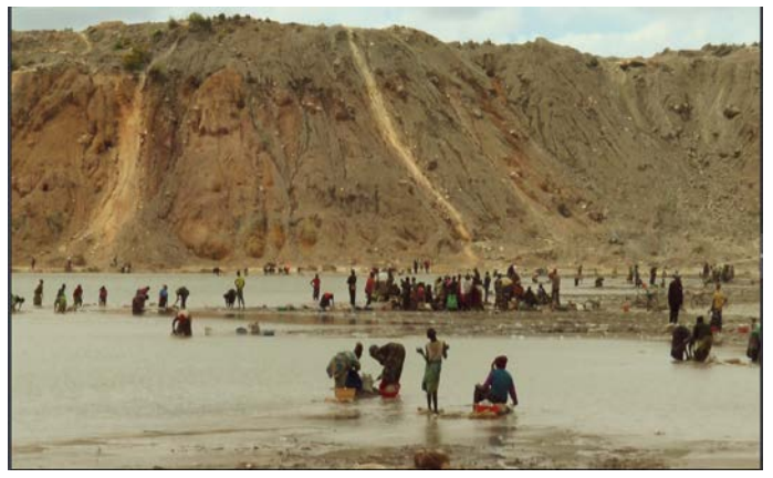
居民明知工作危險，但別無選擇