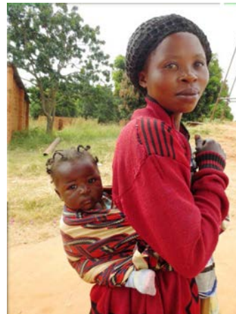
為了孩子，婦女必須於危險中艱苦求生