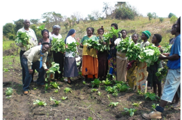
他們不願在礦場工作，希望在農場迎接新生活