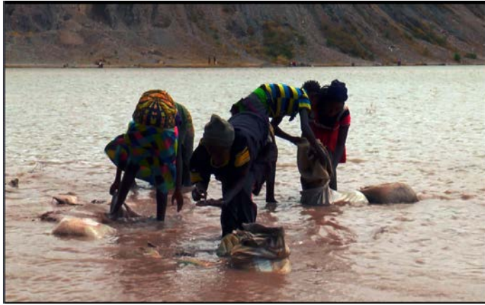
這裡的湖泊，充滿重金屬與鈾礦的放射性