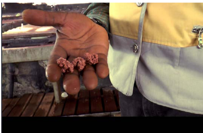
剛果蘊含巨量資源