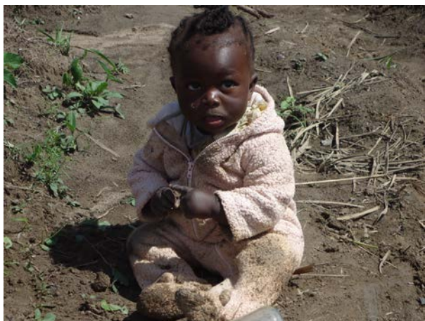
在這裡，要養活孩子非常辛苦