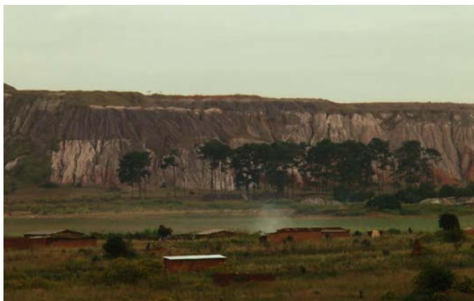
剛果一直為世界各地供應原物料