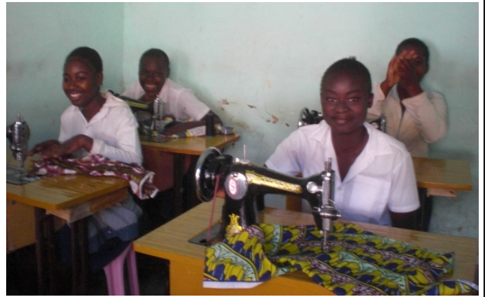
婦女若能自立，遭受暴力侵害機率也會降低