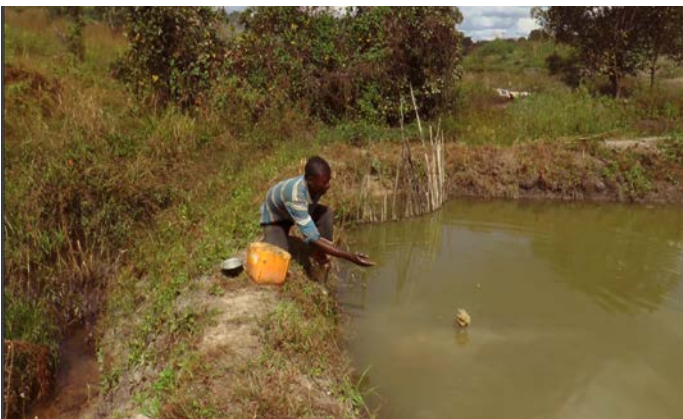
13 位年輕人負責農地的水產養殖