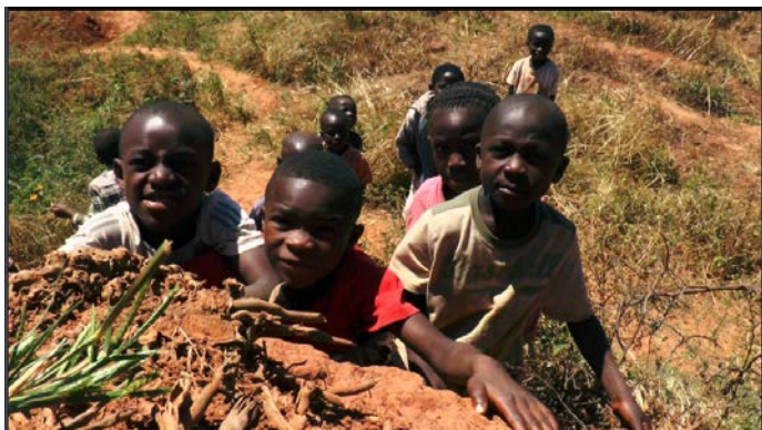
這裡的孩子許多是孤兒(父母因採礦而過世)