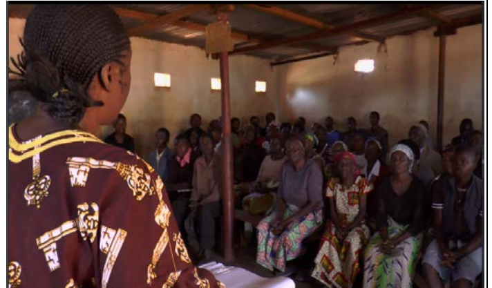
大家努力在這裡開始新生活