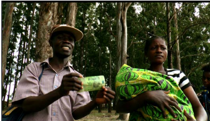
工作一整天才賺一千剛果法郎