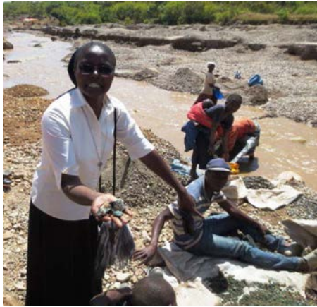
大家都很努力，我們在這擔任技術員指導