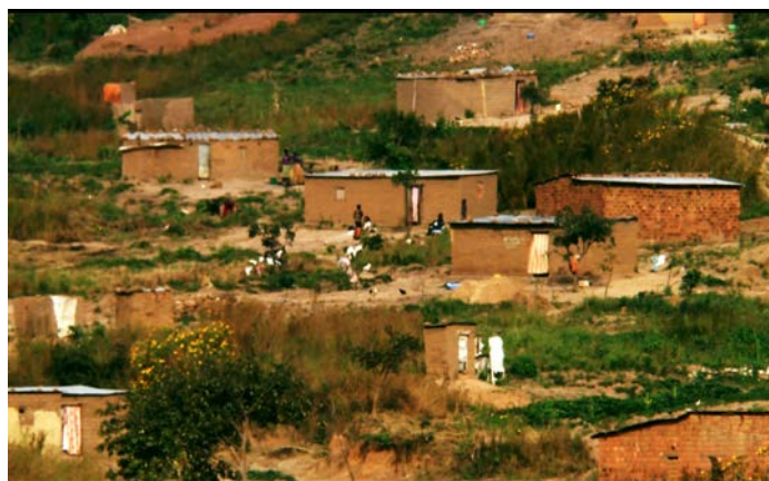
政府允許礦區居民用手工採礦維持生計