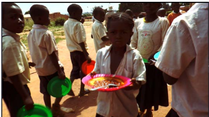
之前孩子一星期只吃一餐