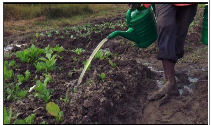
除了栽種蔬菜，還種植至少六公頃的玉米