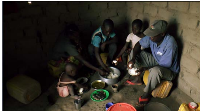
居民生活條件異常貧乏