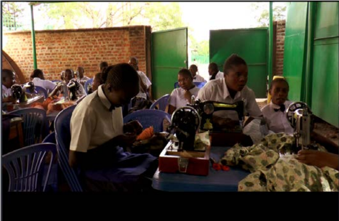
訓練她們具備自立的必要能力