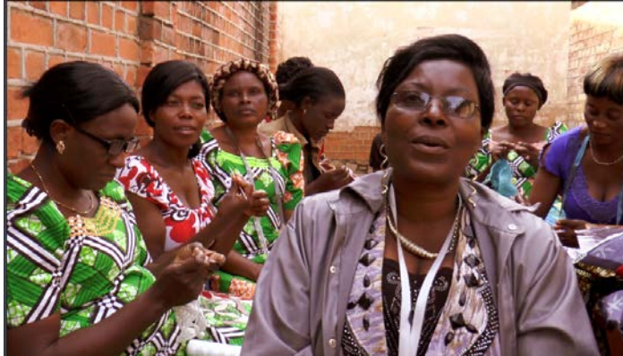
教導婦女識字、剪裁和縫紉