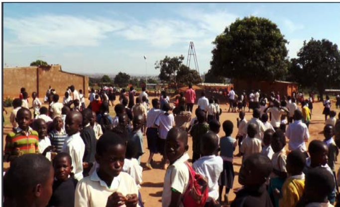
近千名學童及婦女與農人，在卡尼納建立新社區