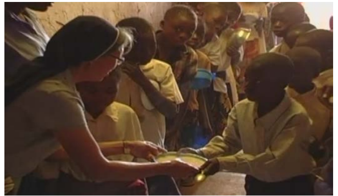
我們的目標並不限於學校，還包括孩子的未來