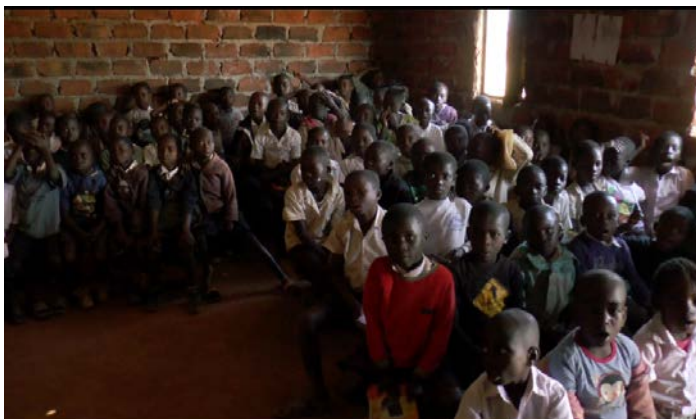
因孩童人數眾多造成每班大量超額