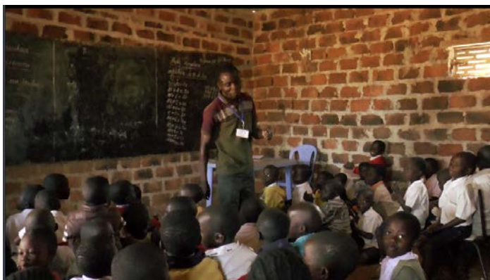
善牧國際總會的非正式學校授課