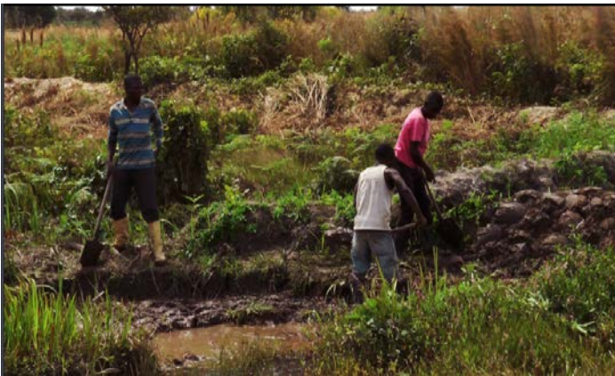
居民努力耕作希望改善生活