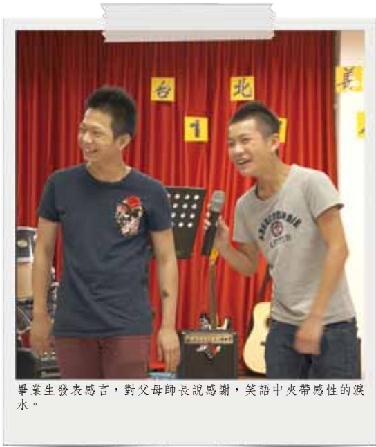
畢業生發表感言，對父母師長說感謝，笑語中夾帶感性的淚水。