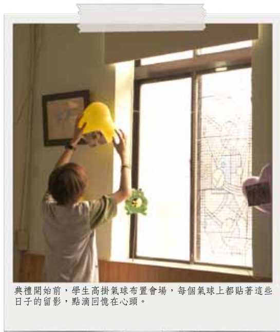
典禮開始前，學生高掛氣球布置會場，每個氣球上都貼著這些日子的留影，點滴回憶在心頭。