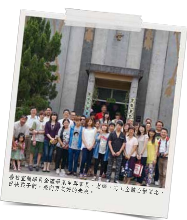
善牧宜蘭學員全體畢業生與家長、老師，志工全體合影留念，祝扶孩子們，飛向更美好的未來。