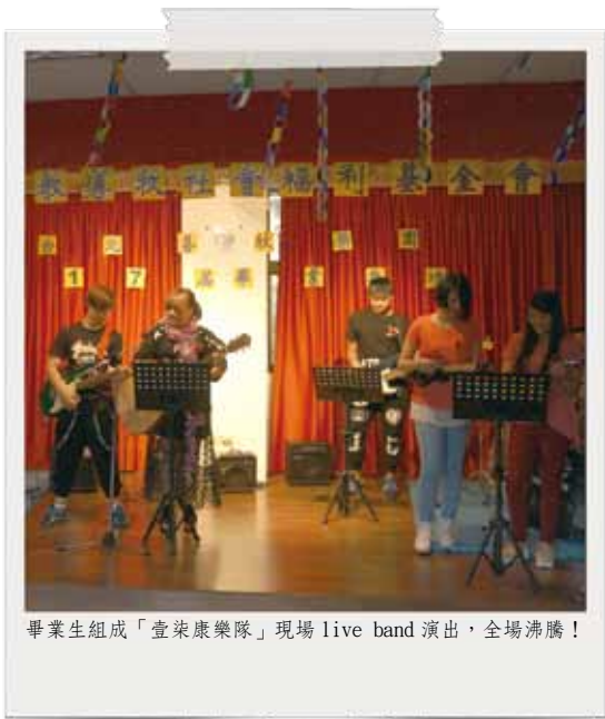
畢業生組成「壹柒康樂隊」現場live band演出，全場沸騰！