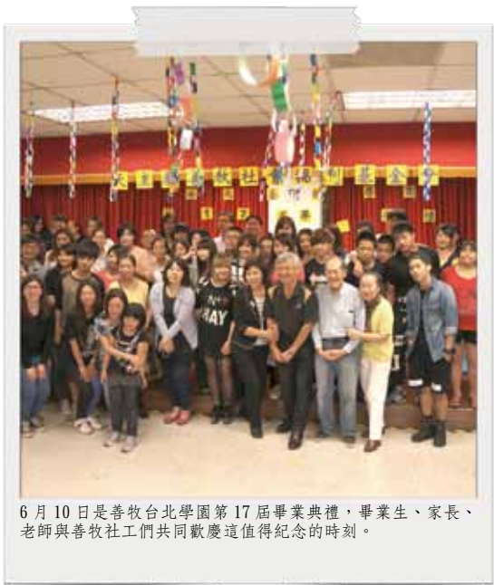
6月10日是善牧台北學園第17屆畢業典禮，畢業生、家長、老師與善牧社工們共同歡慶這值得紀念的時刻。