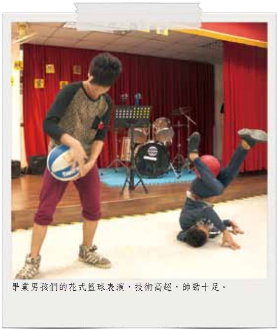
畢業男孩們的花式籃球表演，技術高超，帥勁十足。