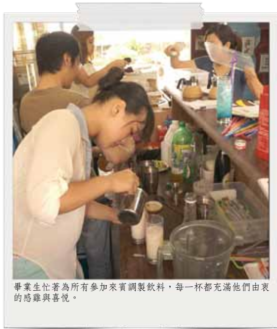
畢業生忙著為所有參加來賓調製飲料，每一杯都充滿他們由衷的感戴與喜悅。