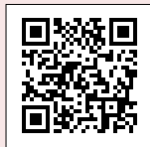
台糖 APP iOS 手機下載