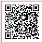
台糖 APP Android 手機下載