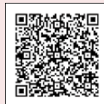
台糖 APP 點數捐贈步驟